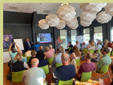
Bestuurlijke uitwisseling 2023