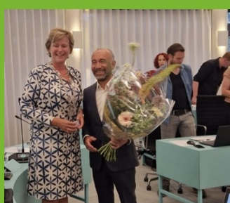
Benoeming nieuwe wethouder financiën