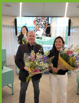
Benoeming Rekenkamer leden