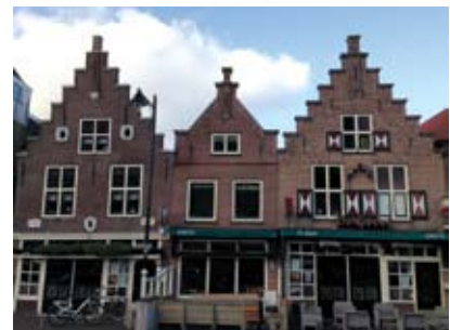
2.2 Historische Markt

Over de oorsprong van de kermis bestaan verschillende versies. In de Romeinse tijd werden jaarlijks markten georganiseerd, Forum genaamd. In de Franse taal is dat "foire" en in de Engelse taal "fair" en in de Nederlandse taal de "jaarmarkt". Mensen