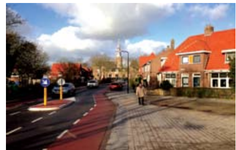
3.6 Alternatief Julianalaan

De attracties worden geplaatst op een in overleg vooraf op tekening schaal 1:200 vastgestelde plaats. Hierbij is rekening gehouden met de wettelijk