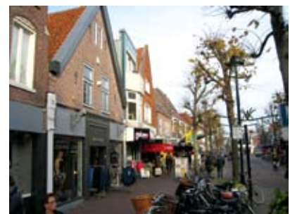
3.3 Alternatief Markt - Gedempte Gracht

De kermislocatie Markt - Nieuwstraat is met ingang van 2016 niet meer beschikbaar hebben we gelezen in paragraaf 3.3. Alternatieve locaties zijn bestudeerd. Uitgangspunt is dat ook in de toekomst na de eeuwenlange traditie rondom de kerk (kerkmis, kermis) op de Markt kermis zal zijn. De horeca is hier nadrukkelijk aanwezig en de link kermis-horeca moet ook in de toekomst in stand blijven. Voor een succesvolle kermis is het van belang dat het kermisterrein uit één, aaneengesloten terrein bestaat. Gemeten vanaf het midden van de kerk tot aan het einde van de Nieuwstraat is de loopafstand 360 meter. Braakliggende terreinen met bestemming bouwen zoals het terrein van Wooncompagnie aan de