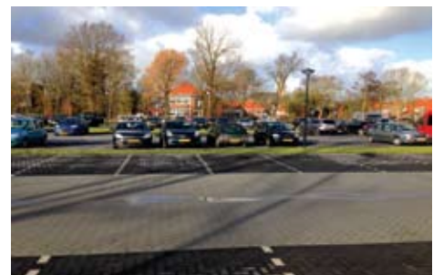
3.7 samen met Parkeerplaats Julianalaan