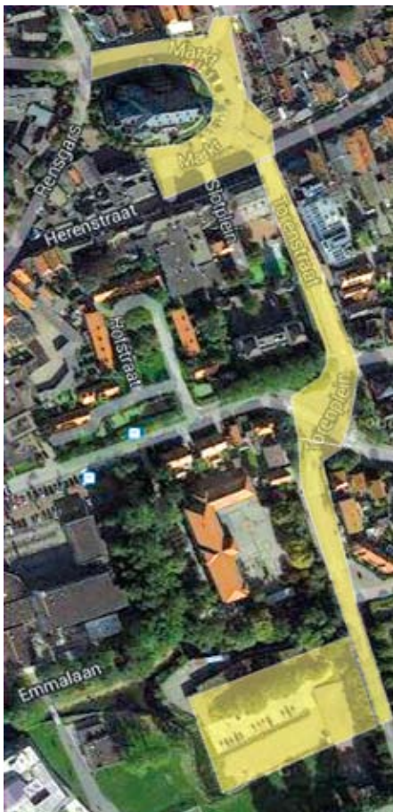
3.5 Alternatief Markt - Julianalaan vanaf 2016

Het is van groot belang om op korte termijn voor kermis 2016 Scenario 3, Markt - Julianalaan als nieuw kermisterrein aan te wijzen (afbeelding 3.5; 3.6 en 3.7). Omwonenden, ondernemers en instituten moeten in de plannen gekend worden en betrokken worden bij de uitwerking.