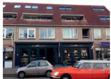
2.3 Winkelen in de Nieuwstraat