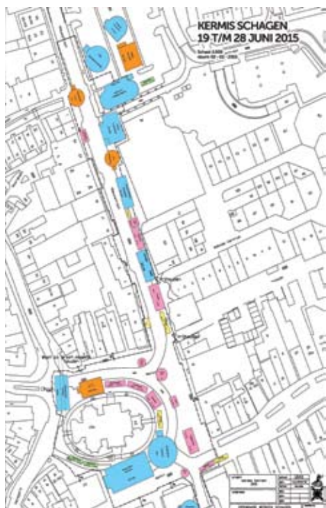
3.2 Kermis 2015 : aantrekkelijker en veiliger

Al deze ontwikkelingen maken de Nieuwstraat met ingang van 2016 ongeschikt als kermisterrein.