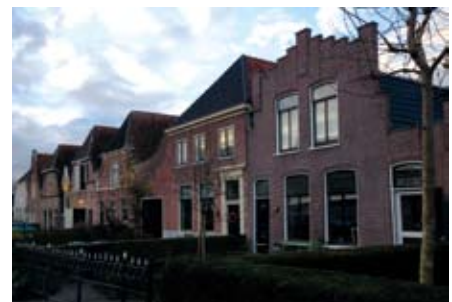
3.4 Alternatief Markt - Loet