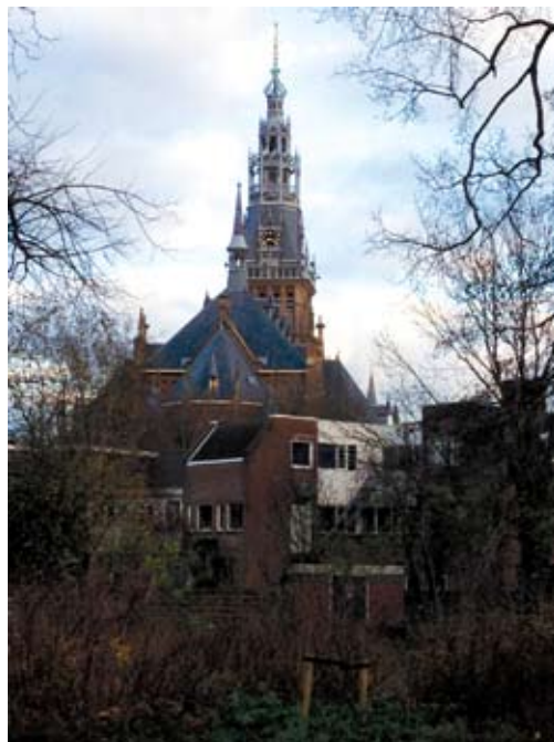
2.1 Rondom de kerk: kerk mis en kermis

Binnen de gemeentelijke organisatie zijn gesprekken gevoerd over het functioneren van de kermis met betrokken ambtenaren, de wethouder en de burgemeester. Extern is gesproken met een vertegenwoordiger van Stichting Evenementen Schagen (SES), Winkeliers Vereniging Schagen (WVS) en Winkelcentrum Makado. Zes horeca ondernemers, verantwoordelijk voor elf bedrijven in het centrum zijn individueel gesproken. Het door de horeca ingehuurd beveiligingsbedrijf is geconsulteerd. Na deze inventariserende gesprekken is er een gesprek gevoerd met de directie van de