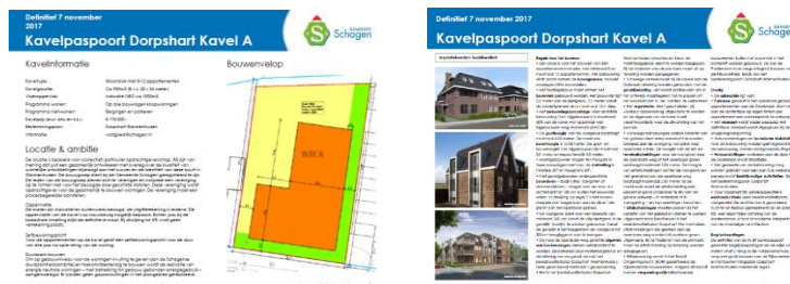
Afbeelding: voorbeeld kavelpaspoort