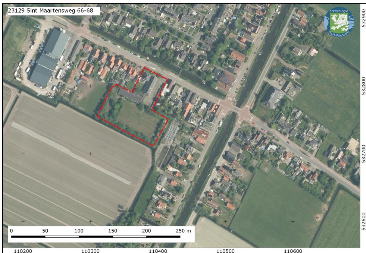
Afbeelding 1. Ligging plangebied Sint Maartensweg 66-68 op een recente luchtfoto.

In onderstaand advies wordt kort aangegeven of en hoe de archeologie en cultuurhistorie geborgd dient te worden in het ontwerp bestemmingsplan. Dit kan opgenomen worden in paragraaf 4.1 en 4.2 van de toelichting. Het archeologisch onderzoek dat is uitgevoerd in 2008 dient te worden opgenomen als bijlage in het ontwerp bestemmingsplan.