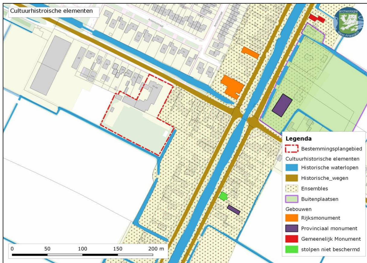
Afbeelding 4. Ligging plangebied Sint Maartensweg op de cultuurhistorische elementenkaart.