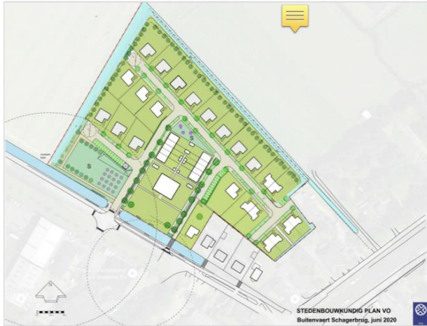
afb.4 Stedenbouwkundig plan VO

Met dit bestemmingsplan wordt de realisatie van maximaal 40 woningen mogelijk gemaakt. Het gebied wordt vanaf de Schagerweg ontsloten. De voorgenomen ontwikkeling is uitgewerkt in een beeldkwaliteitsplan, als aanvulling op het welstandsbeleid van de gemeente (zie hoofdstuk 4). Het beeldkwaliteitsplan is opgenomen in bijlage 3 bij deze toelichting.