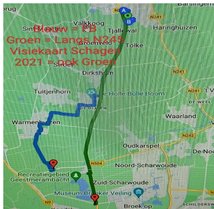
Afbeelding 1: route via Dirkshorn, Tuitjenhorn en Warmenhuizen

Naar aanleiding van dit onderzoek zijn er op 18 en 19 oktober in Schagen en Warmenhuizen inloopavonden geweest waar men een inbreng kon geven over de plannen tot nu toe. Bij de inloop avond in Schagen kwam naar voren dat men gebruik wil maken van bestaande fietspaden met alle bochten en kruisingen en gevaarlijke oversteekplaatsen daar in. Het fietspad loopt dan van Schagen langs Dirkshorn naar Tuitjenhorn en Warmenhuizen, richting Alkmaar (zie blauwe route onderstaande afbeelding).