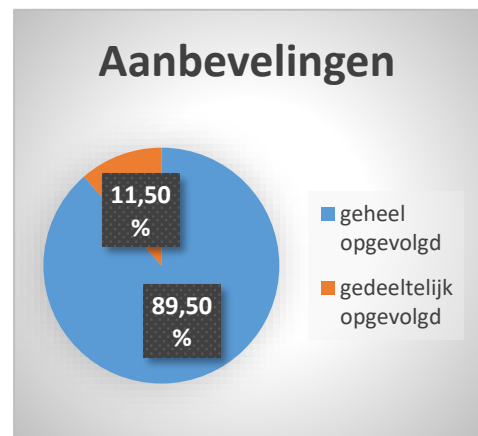
Figuur 2 Overzicht van de verhouding geheel en gedeeltelijk opgevolgde aanbevelingen