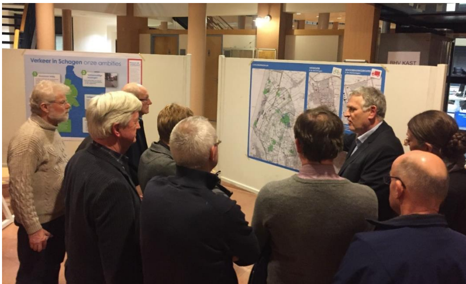
Themabijeenkomst 14 februari GVVP 1

Verder zijn er naast de themabijeenkomsten meerdere informatie/overleg bijeenkomsten geweest waarvoor de raad en ook de commissies zijn uitgenodigd.