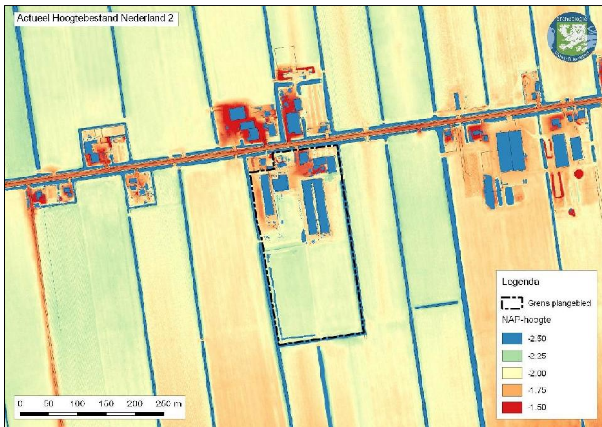
Afbeelding 6. Ligging plangebied op het Actueel Hoogtebestand Nederland

Op basis van het raadplegen van historisch kaartmateriaal, Achis, het AHN en de geomorfologische kaart is geen aanleiding om ter hoogte van het plangebied een middeleeuwse terp te vermoeden. De zeer hoge verwachting kan naar beneden worden bijgesteld.