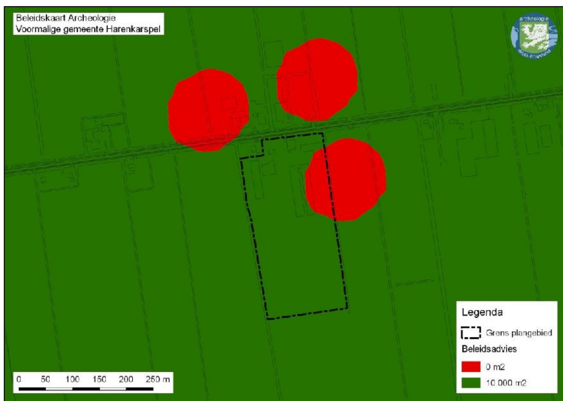
Afbeelding 2. Ligging plangebied op de beleidskaart archeologie.