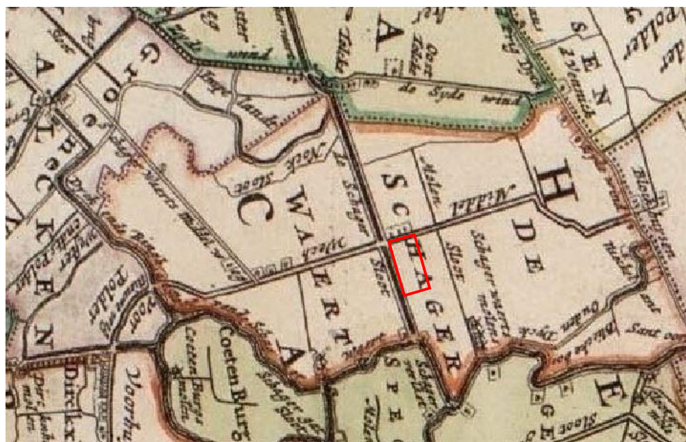
Afbeelding 4. Globale ligging plangebied op kaart van Dou uit 1682.