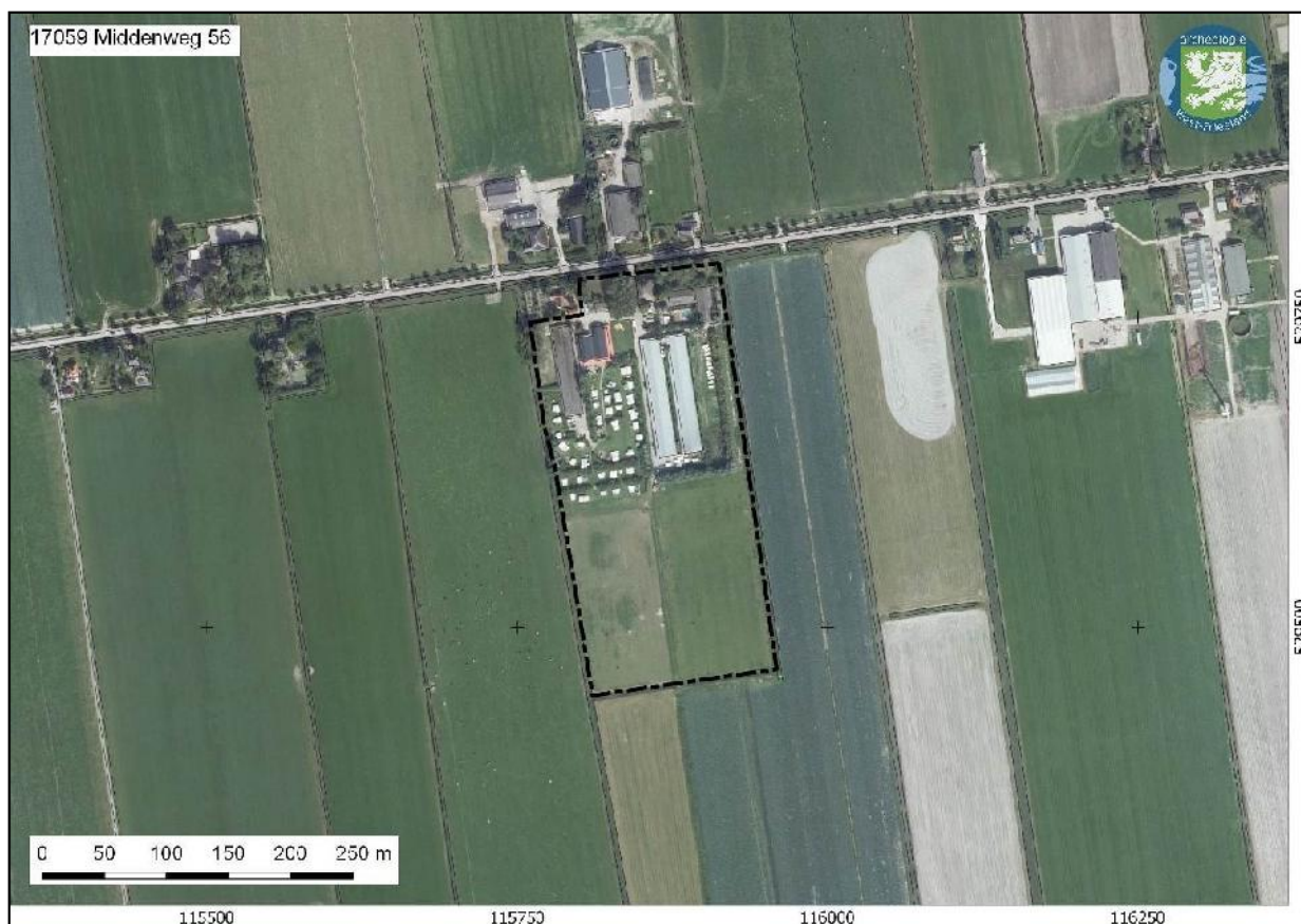
Afbeelding 1. Ligging plangebied