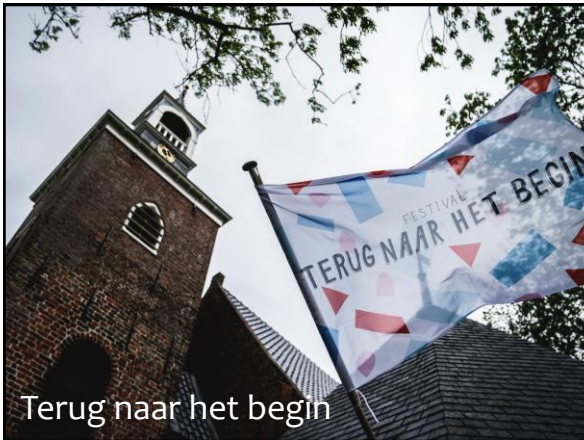
Terug naar het begin