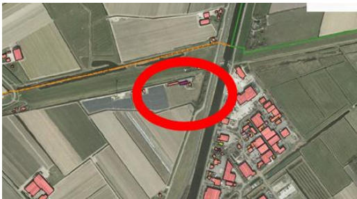
Parallelweg 't Zand