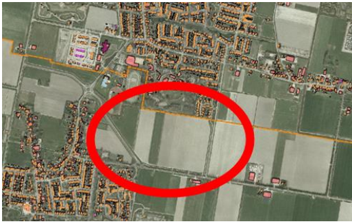
Tussengebied Warmenhuizen / Tuitjenhorn