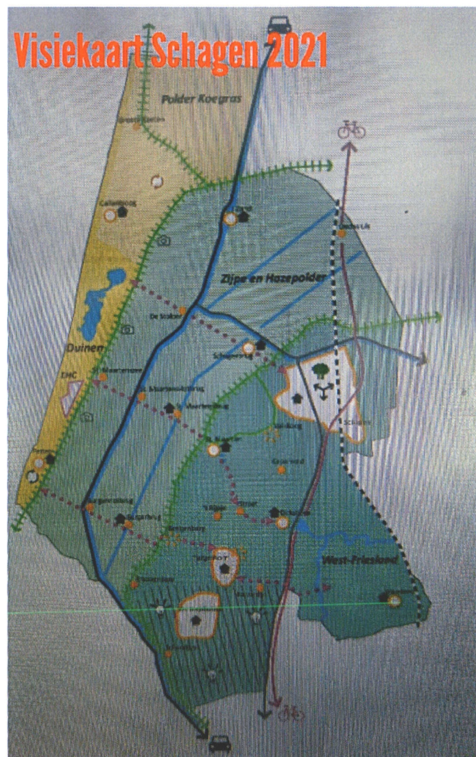
Afbeelding 2: Uit omgevingsvisie. Route langs de N245 richting Alkmaar.

Gehoord en gelezen hebbende de presentaties over de doorfietsroutes (zie afbeelding 1) zoals verzorgd tijdens de inloopavonden op 18 en 19 oktober in Schagen en Warmenhuizen als onderdeel van het project doorfietsroute: