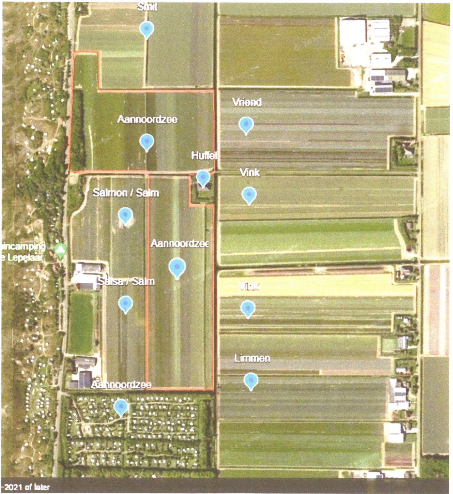
-2021 of later