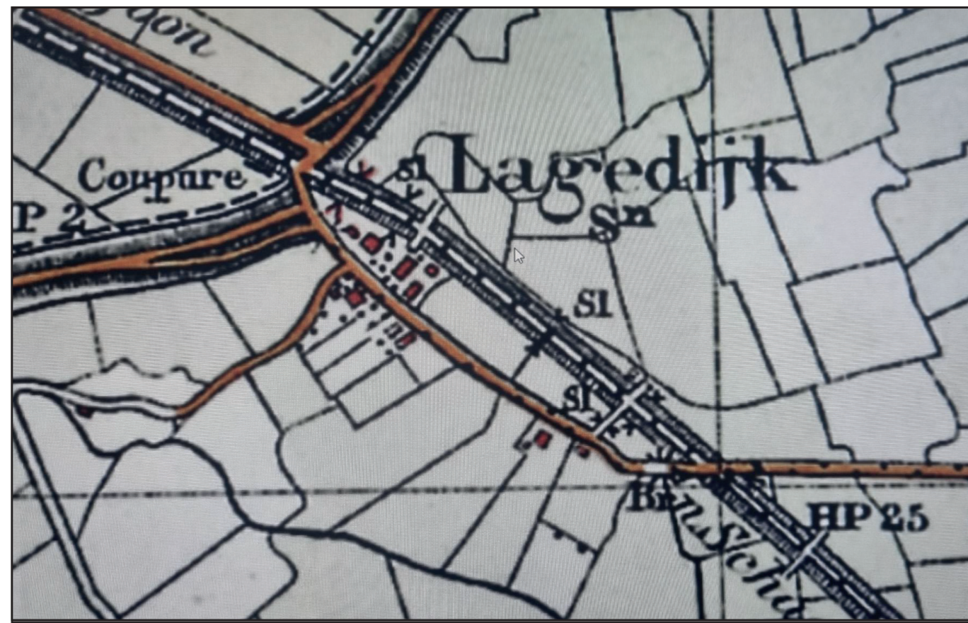
Historische kaart 1924 met het voormalige tramtracé