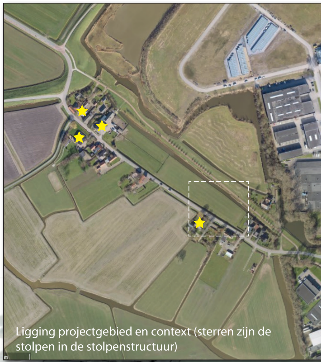
Ligging projectgebied en context (sterren zijn de stolpen in de stolpenstructuur)