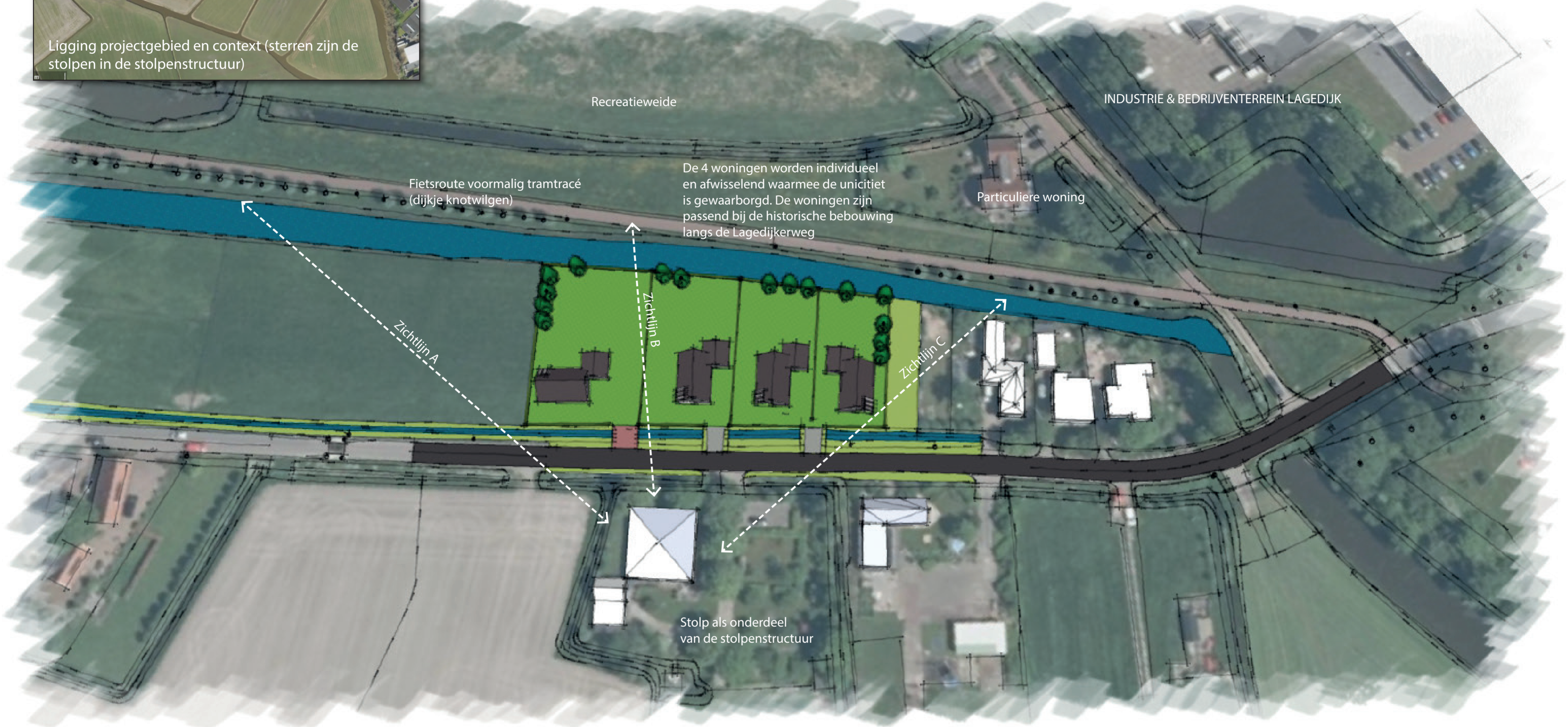
Vogelvlucht van de voorgestelde situatie