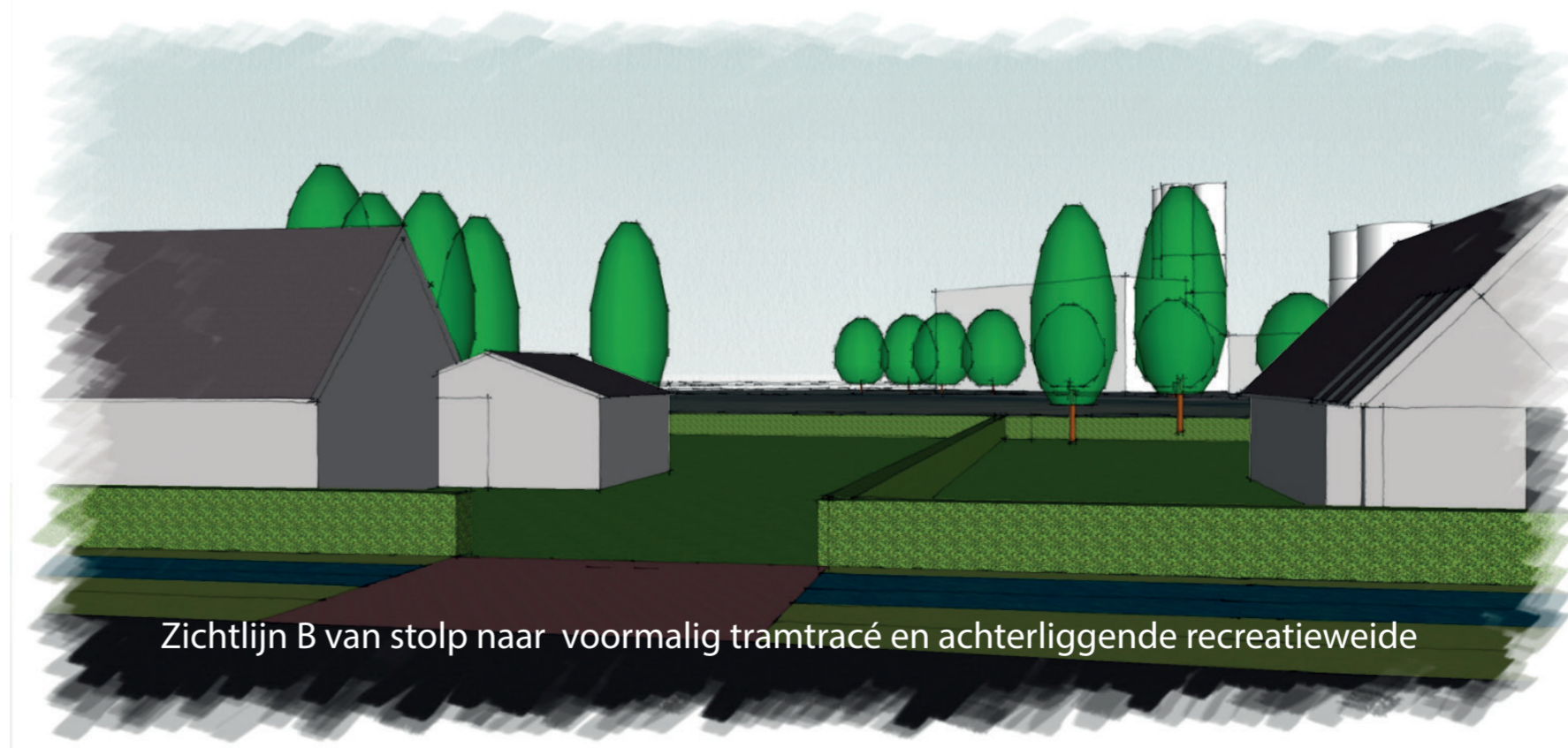
Zichtlijn B van stolp naar voormalig tramtracé en achterliggende recreatieweide