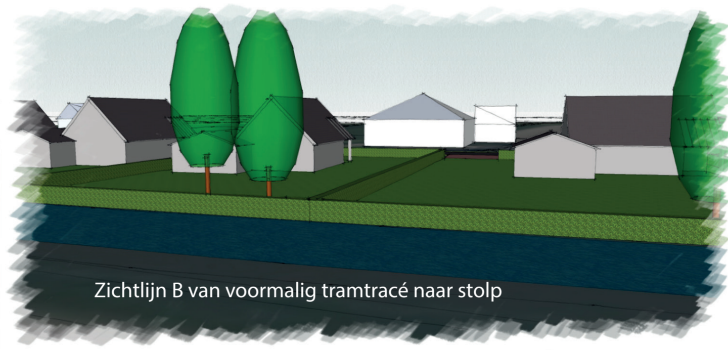
Zichtlijn B van voormalig tramtracé naar stolp