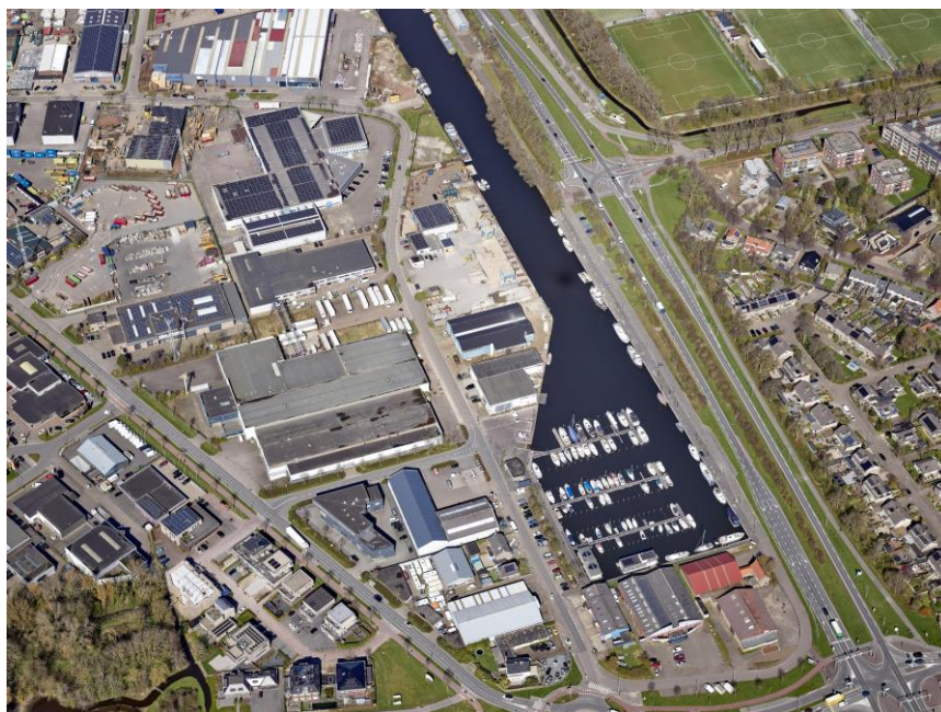
Foto 7: Bedrijventerrein Lagedijk van bovenaf gezien

Zoals opgenomen in de provinciale verordening is in 2022 een regionaal convenant werklocaties afgesloten. In dit convenant wordt voor wat betreft de gemeente Schagen aangegeven dat wordt ingezet op het uitbreiden van bestaande werklocaties om de vraag van bedrijven die lokaal geworteld zijn, te kunnen faciliteren. Gezien het overige aanbod in de regio zal de gemeente een goede onderbouwing in het kader van de Ladder voor Duurzame Verstedelijking moeten op stellen. Als eerste stap moet de concrete behoefte van de lokale bedrijven worden geïnventariseerd.