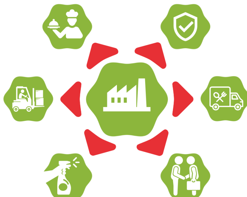
Foto 1: Industrie als stuwende sector

essentieel gezien hun directe werkgelegenheid. Maar vooral ook vanwege hun effecten op andere bedrijven en de indirecte werkgelegenheid.