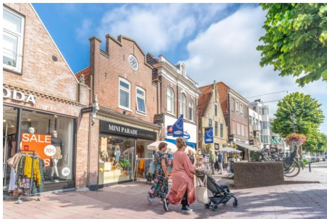
Foto 5: Winkelstraat in het centrum van Schagen

Duidelijk is enerzijds dat het online-shopperen door zal zetten, maar anderzijds dat fysieke winkels hun aantrekkingskracht behouden. Dit is en blijft van grote invloed op de aard en omvang van het winkelaanbod in onze gemeente en met name in de kern Schagen. De binnenstad van de kern Schagen heeft voldoende potentie om zich als aantrekkelijk verblijfsgebied te profileren en zich als 'complete binnenstad' aan te bieden. Om de mogelijkheden om de kwaliteit van het winkelgebied te verbeteren en zo de binnenstad aantrekkelijker te maken als verblijfsgebied, inzichtelijk te maken, wordt, samen met de ondernemers, een (integrale) centrumvisie opgesteld.