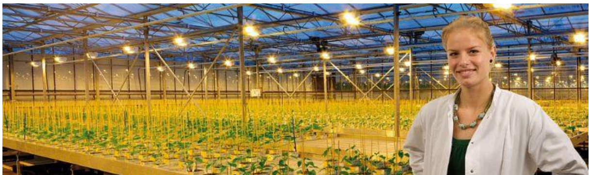
Foto 2: Seed Valley

Samen vormen zij hét kenniscentrum als het gaat over plantveredeling en zaadtechnologie. Hier worden gewassen ontwikkeld die onder andere een hogere opbrengst geven, resistent zijn tegen ziektes of lekkerder smaken. En met zo min mogelijk gebruik van ruimte, energie en water. In Nederland werken er ruim 3.500 medewerkers in Seed Valley. Dit zijn medewerkers van alle opleidingsniveaus en uit diverse vakgebieden: van onderzoek & verdeling tot verkoop en van HR tot productie.