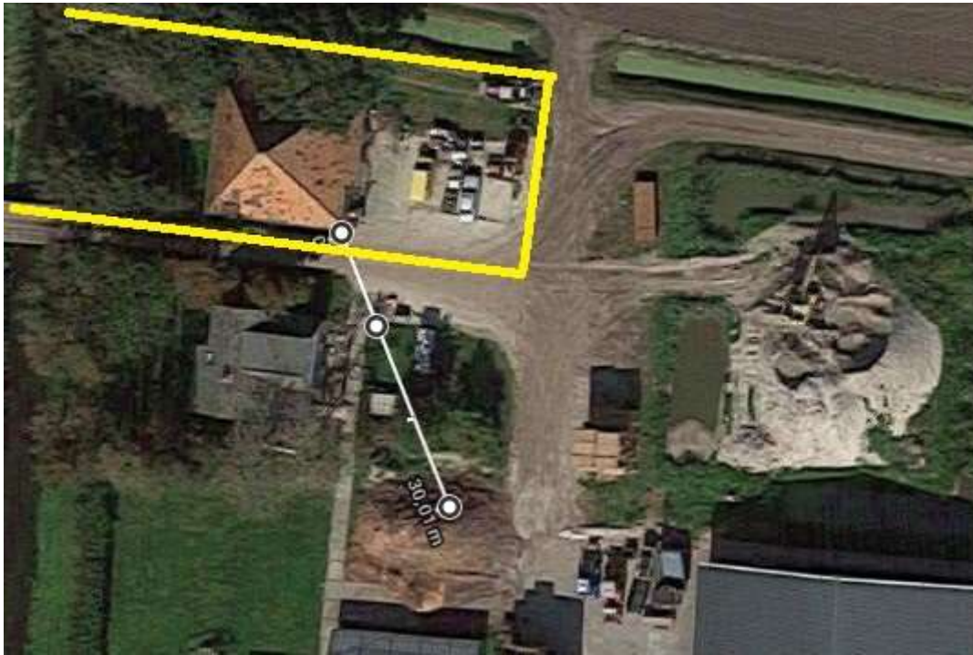
Afbeelding 5 Indicatie van afstanden vanuit de beoogde stolpwoning

verkleind tot 10 meter. In onderstaande afbeelding zijn beide afstanden vanuit de beoogde woning weergegeven. Hieruit blijkt dat op een afstand van 10 er geen relevante activiteiten plaatsvinden.